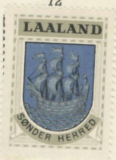
Laalands Sønder Herred

Vestenskov, Kappel, Arninge, Dannare, Tillese, Glosunde, Græshave, Landet, Ryde, Søllested, Skovlænge, Gurreby, Avnede, Stokkemarke.